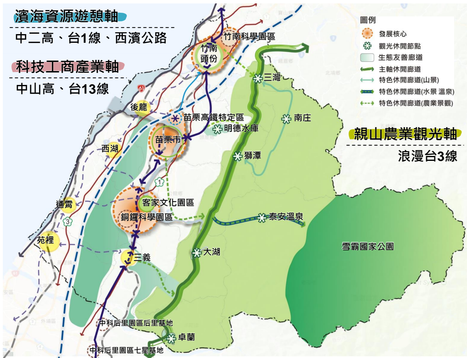
【苗栗縣空間發展構想示意圖】